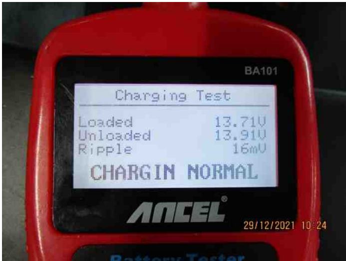
Keterangan: Pengisian Accu