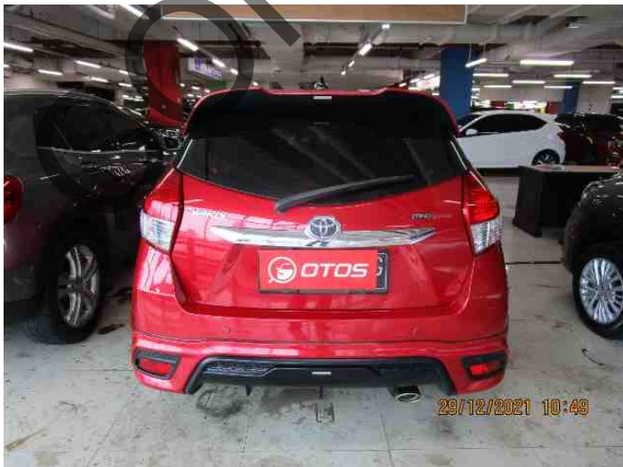
Keterangan: Tampak belakang