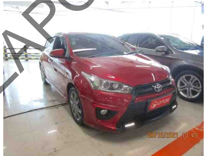
Keterangan: Kanan depan (utama)