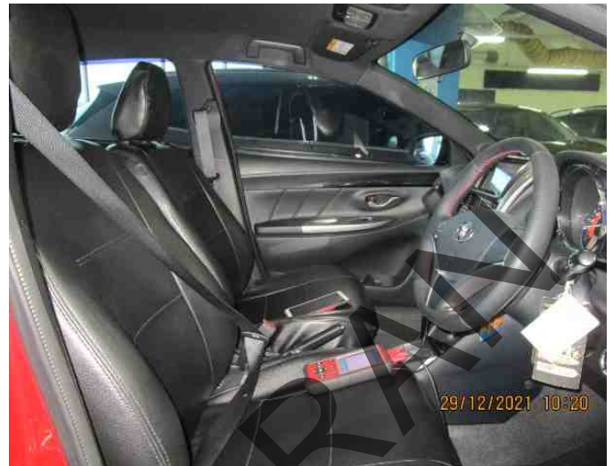
Keterangan: Kabin depan