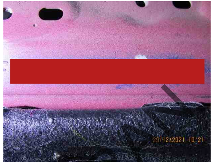
Keterangan: No. rangka