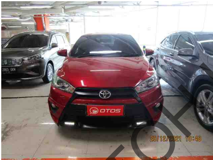
Keterangan: Tampak depan